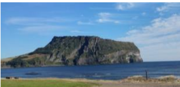
城山日出峰 是韓國第420號天然紀念物, 於2007年列入世界自然遺產, 亦被指定為世界地質公園代表景點。是濟州島海中的火山噴發後形成的罕見的火山體。