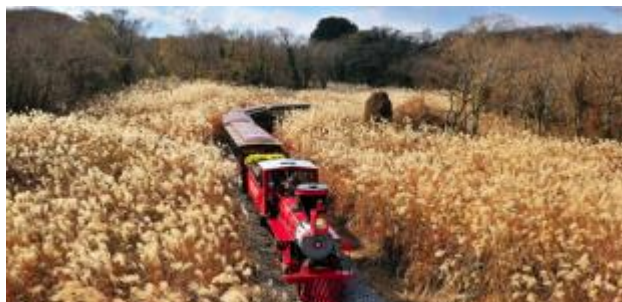
Eco Land 主題公園 是以森林小火車為主題的生態公園·充滿歐洲童話風情。旅客可乘著小火車遊覽綠茶園、玫瑰園等。其中更會經過茂密的芒草坪, 秋日景色甚為秀麗。