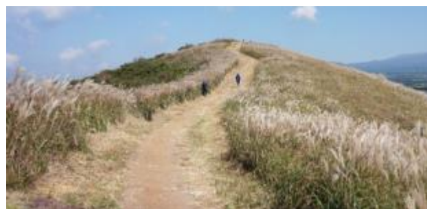
晨星嶽 又名曉星岳, 是濟州島西部著名的小火山。附近有石頭牧場、孤單的樹等知名景點。每到秋季時分, 漫山遍野的紫芒, 份外浪漫, 是絕不能錯過的紫芒秘境。